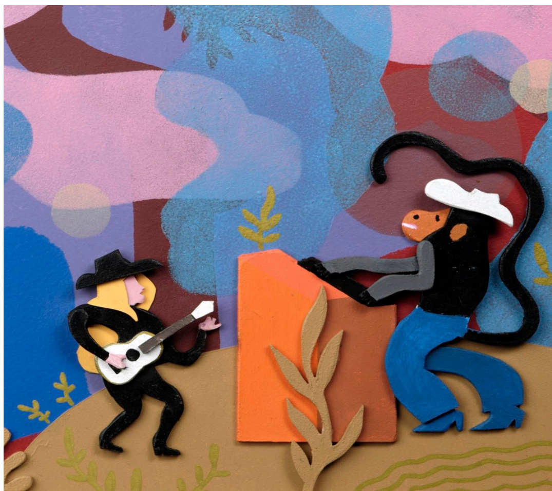
Bas relief en bois,

L'exposition au MANAS a constitué le point de départ d'un projet plus global. L'engagement dans le travail autour de l'exposition a fait naître l'envie chez le duo d'artistes de créer un nouvel album illustré et musical autour des sens : Si Sé Saso Su, qui sortira à l'automne 2025. A l'instar des précédents albums, un spectacle associé sera proposé dès le début de l'année 2026, notamment à l'occasion du festival jeune public Monte dans l'bus .