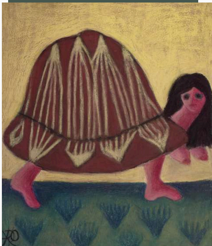
Jetortue. Acrylique et pastel, 50x60

Cette atmosphère fantasque et illusoire cache une réalité plus violente : l'animal pleure face à sa triste condition, sous le joug de l'homme, qui le domestique, le soumet, le tue. L'être humain devient un prédateur redoutable et s'érige comme l'animal le plus dangereux du monde.