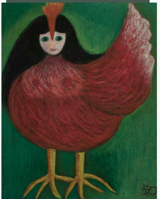
Jepoule. Acrylique et pastel. 50X60