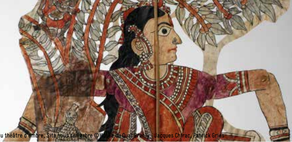
Figure du théâtre d'ombre, Sita sous son arbre