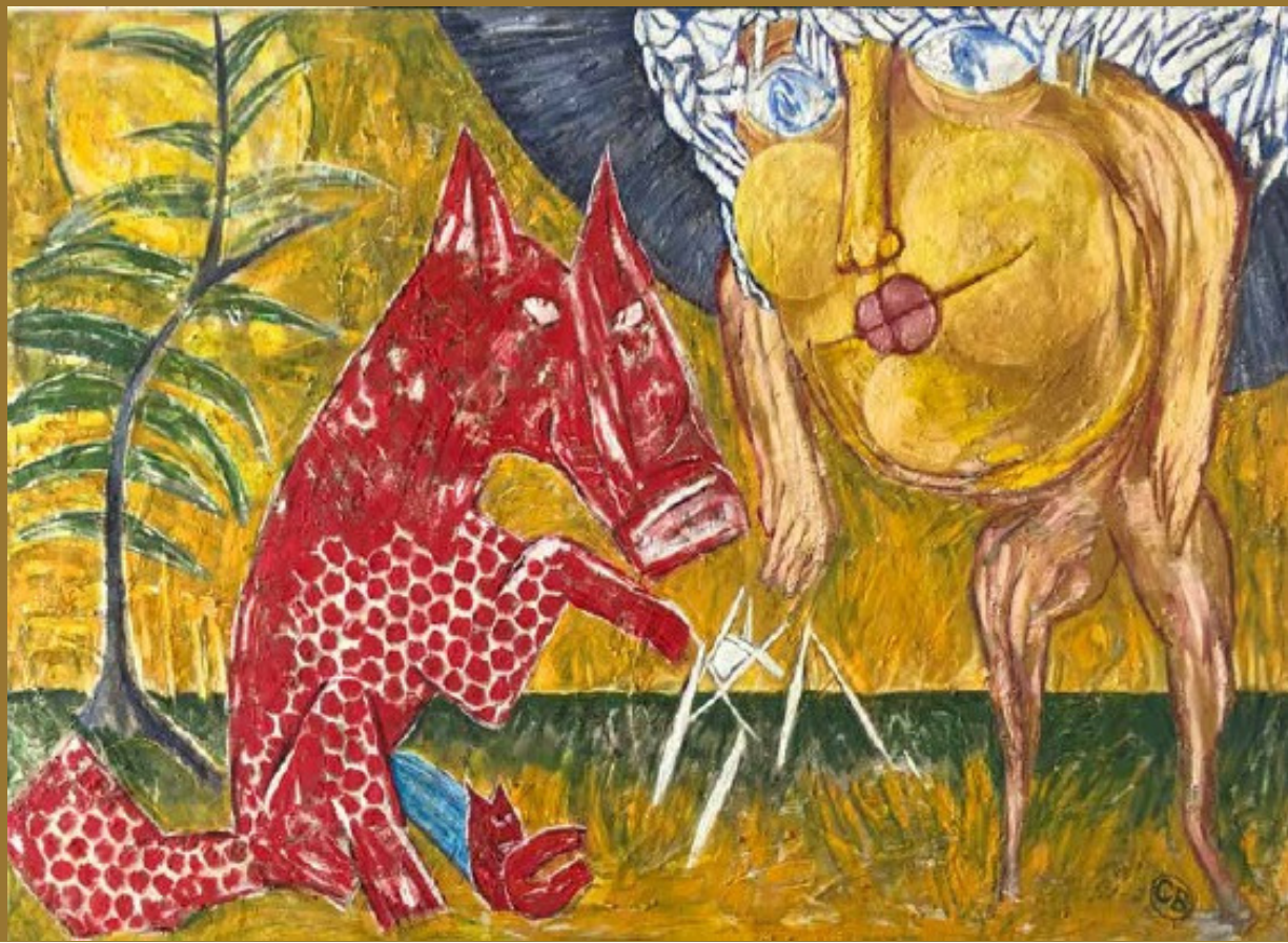
Le Placenta bleu, 1999

« Créer c'est se battre, faire sortir de ses mains et de sa tête son propre monde, inventer son moyen de l'exprimer, affronter l'horrible liberté qui vous chavire devant la surface blanche. Préparer cette surface d'empreintes, de résines, d'arrachages, de sables, c'est préparer une expérience de magie, ce n'est que descendre ou monter les premières marches du puits. »