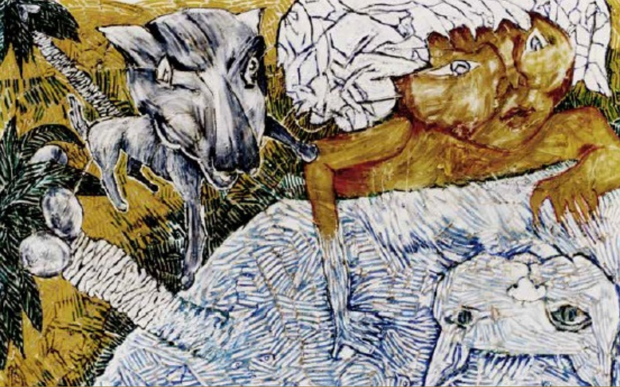
Alterations 1, 1996

« Créer c'est se battre, faire sortir de ses mains et de sa tête son propre monde, inventer son moyen de l'exprimer, affronter l'horrible liberté qui vous chavire devant la surface blanche. Préparer cette surface d'empreintes, de résines, d'arrachages, de sables, c'est préparer une expérience de magie, ce n'est que descendre ou monter les premières marches du puits. »