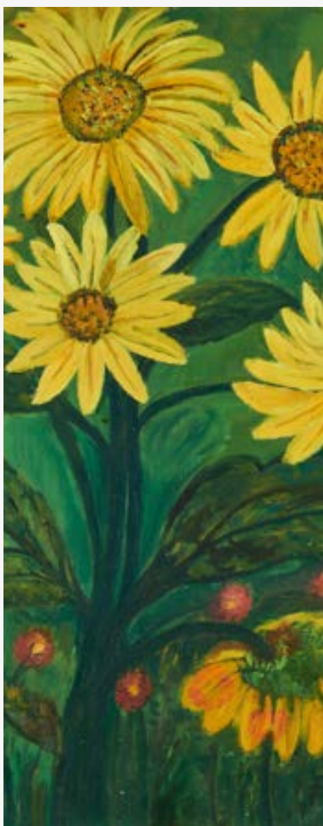
Tournesols, XXème, gouache sur toile, gouache sur toile, Collection privée