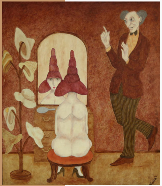
Le chapelier fou, 1999

L'exposition présente 22 œuvres, soit une petite sélection établie dans la production importante de l'artiste qui a dessiné et peint pendant plus de 30 ans.