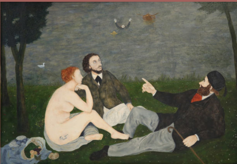
Déjeuner sur l'herbe dérangé, 2003