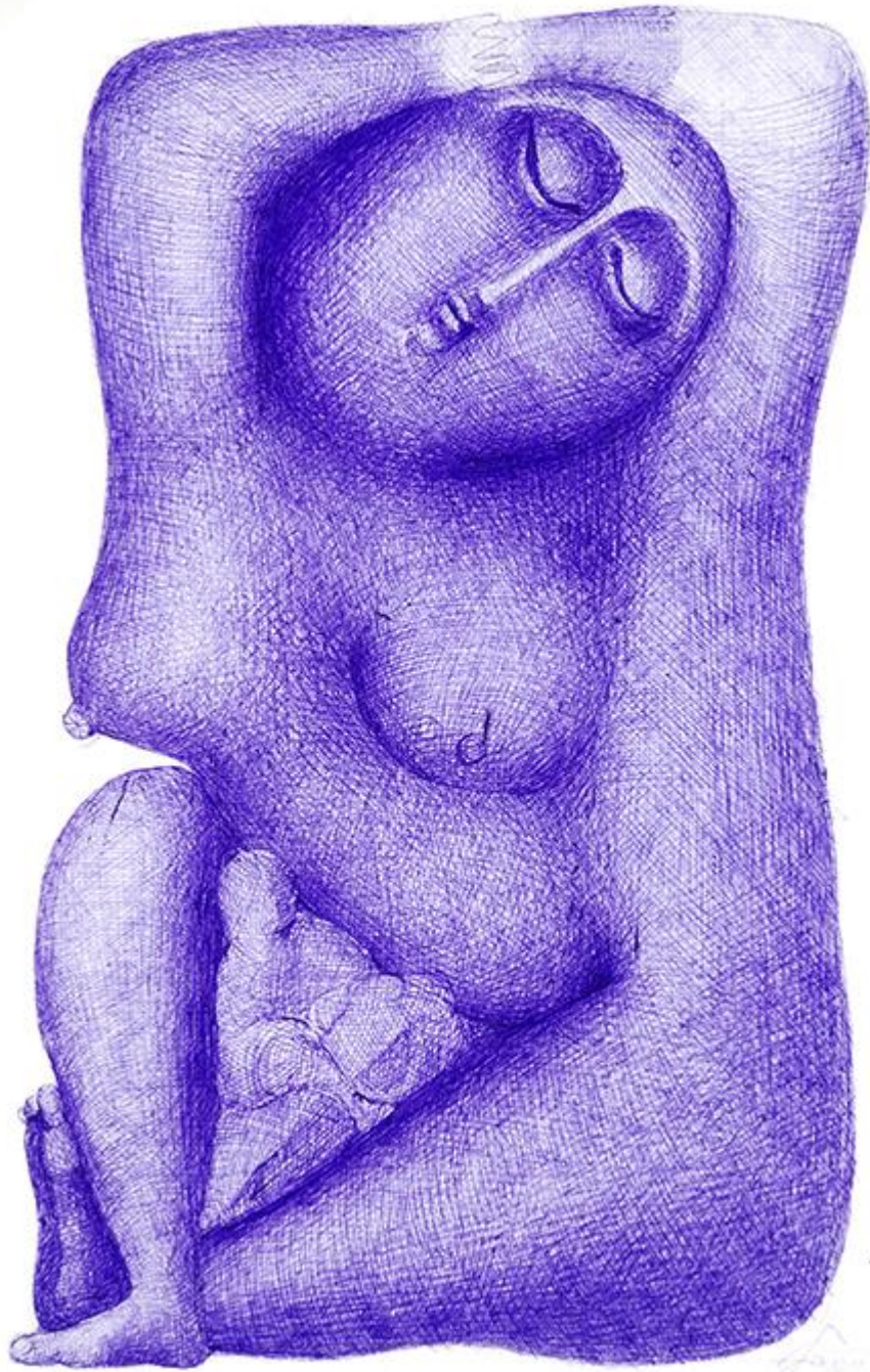
Djoti Bjalava, Sans titre