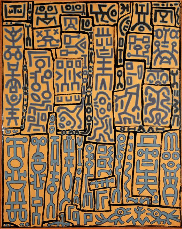
Alain Pauzié, Fracas mental