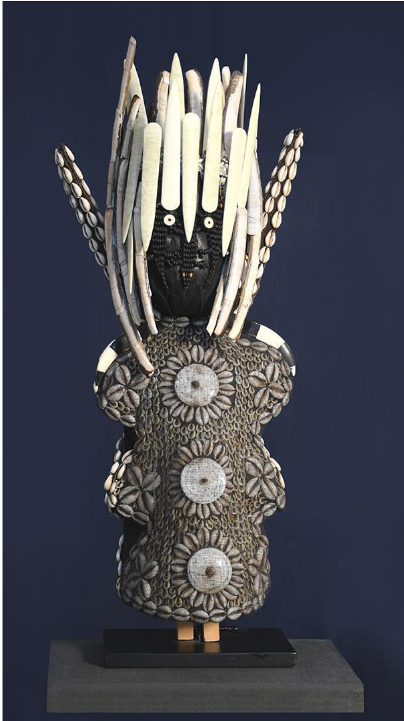
Sabine Darrigan, Figure d'ailleurs 1