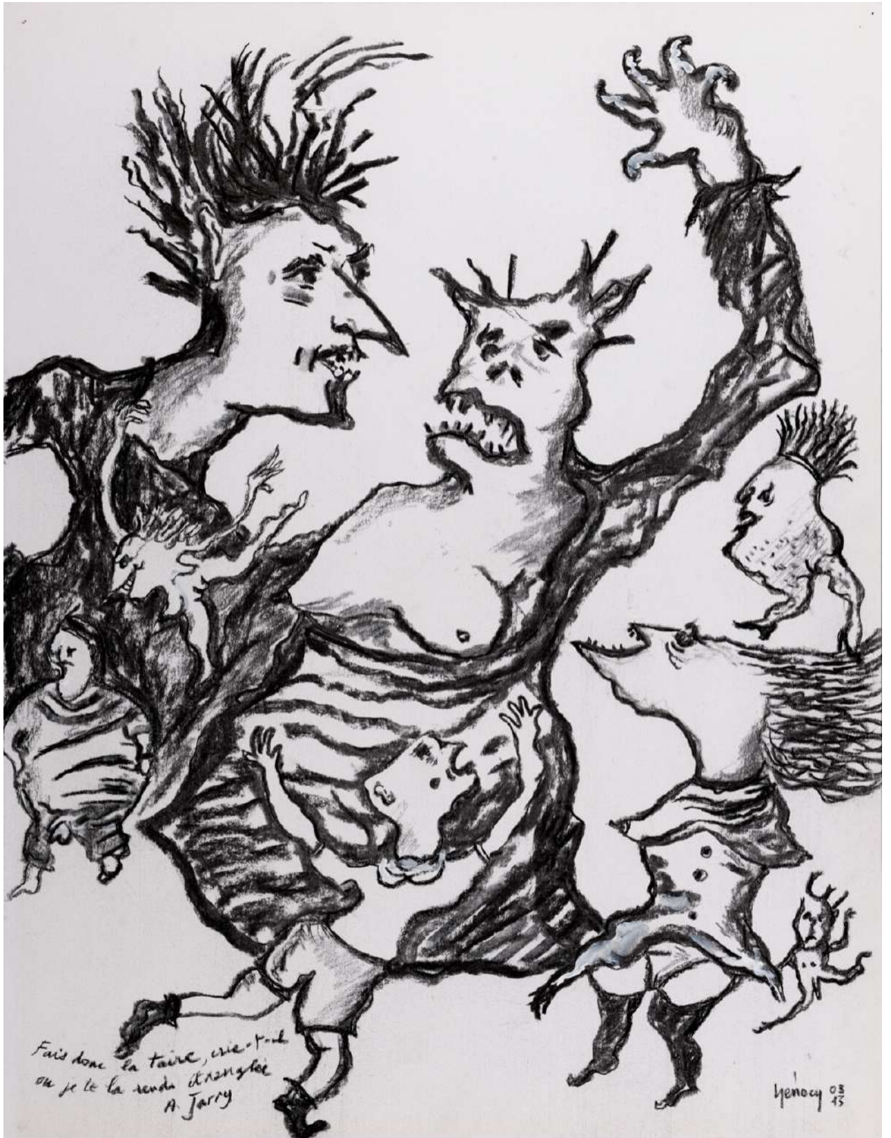
«Fais donc la taire, crie-t-il... ou je Te la rends étranglée.» Les Paralipomènes p 127 (fusain 2013)