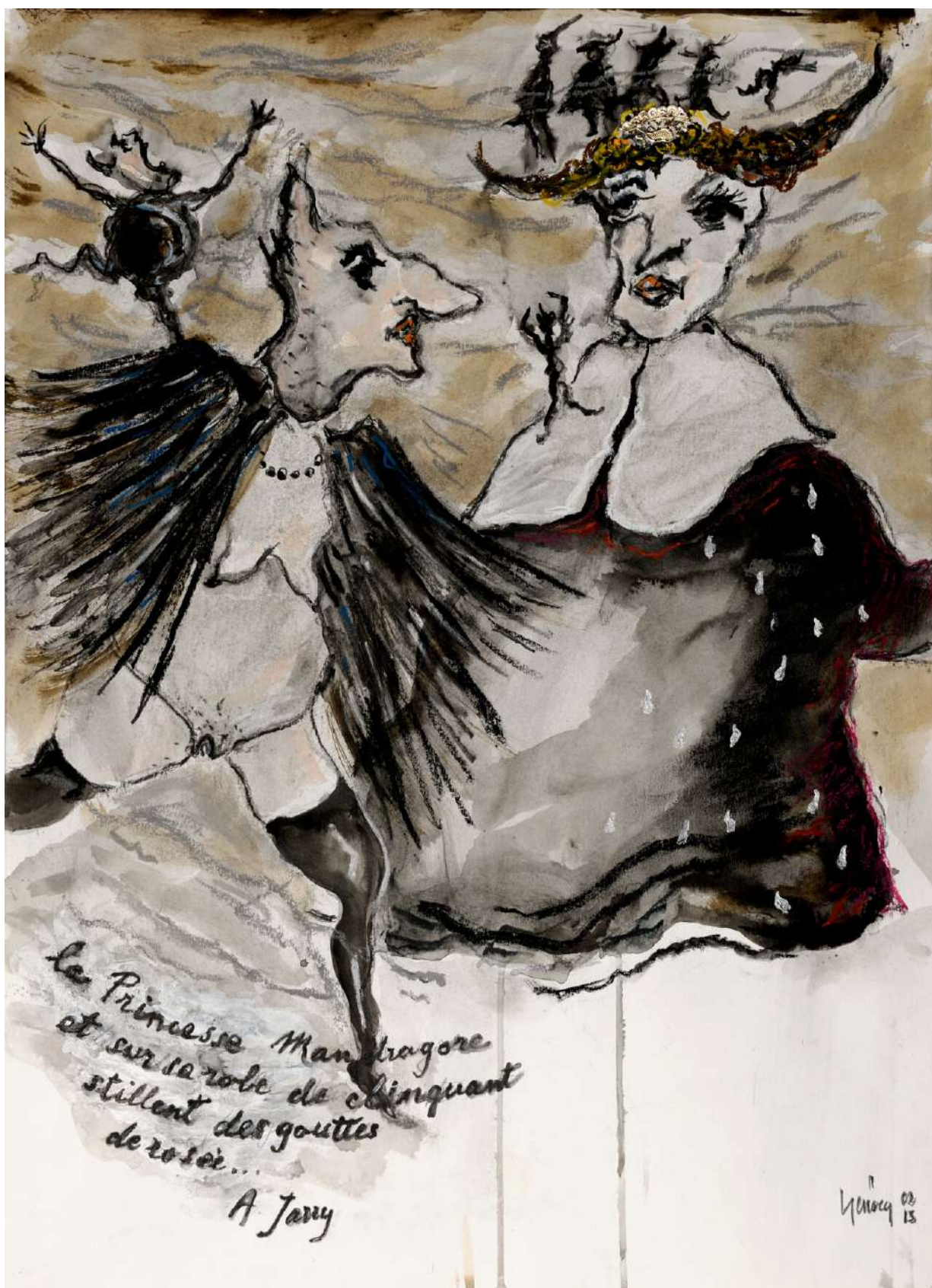
« La Princesse Mandragore... et sur sa robe de clinquants stillent des gouttes de rosée... », Tapisseries p62 (encre, crayon noir rehaussé d'encre et d'acrylique 2013)