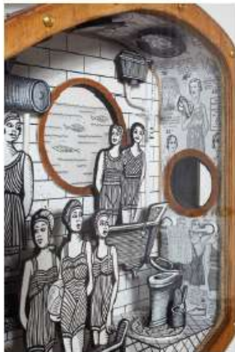
Camera, Le bain des sirènes, détail 2008-2009

« Parmi mes sujets de prédilection figure le cinéma de mon enfance. C'était du cinéma américain car il y en avait très peu en France, à mon époque. Mes objets sont une façon de me défouler avec ce thème. »