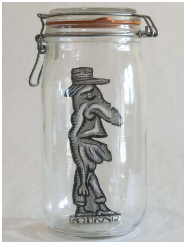
Facteur en retraite Monchâtre