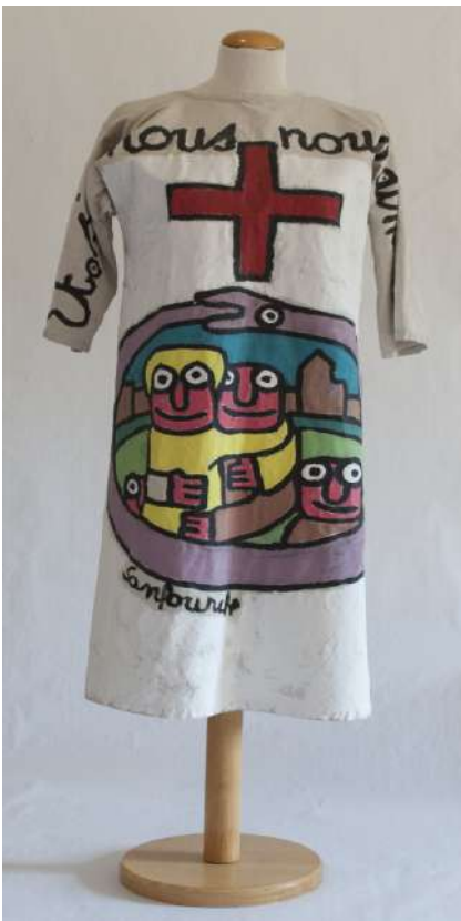
Chasuble peinte Sanfourche

Les « bri-collages » de Lacoste, les enveloppes incongrues de Pauzié, les totems-bijoux de Darrigan, les mosaïques coquillères de Durand, les tissages végétaux de Mirabaud et toutes ces autres oeuvres atypiques nous rappellent avec poésie, sensibilité et humour le temps qui passe et la vanité des choses.