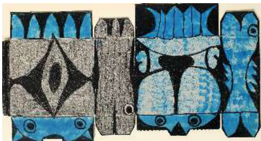
Poissons bleus et gris Albasser