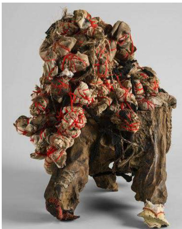
Zoanthropiques, figures Mirabaud