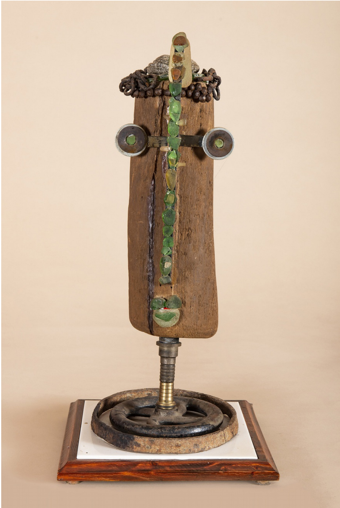
Série africaine, N° 4, L'élégante, 2000