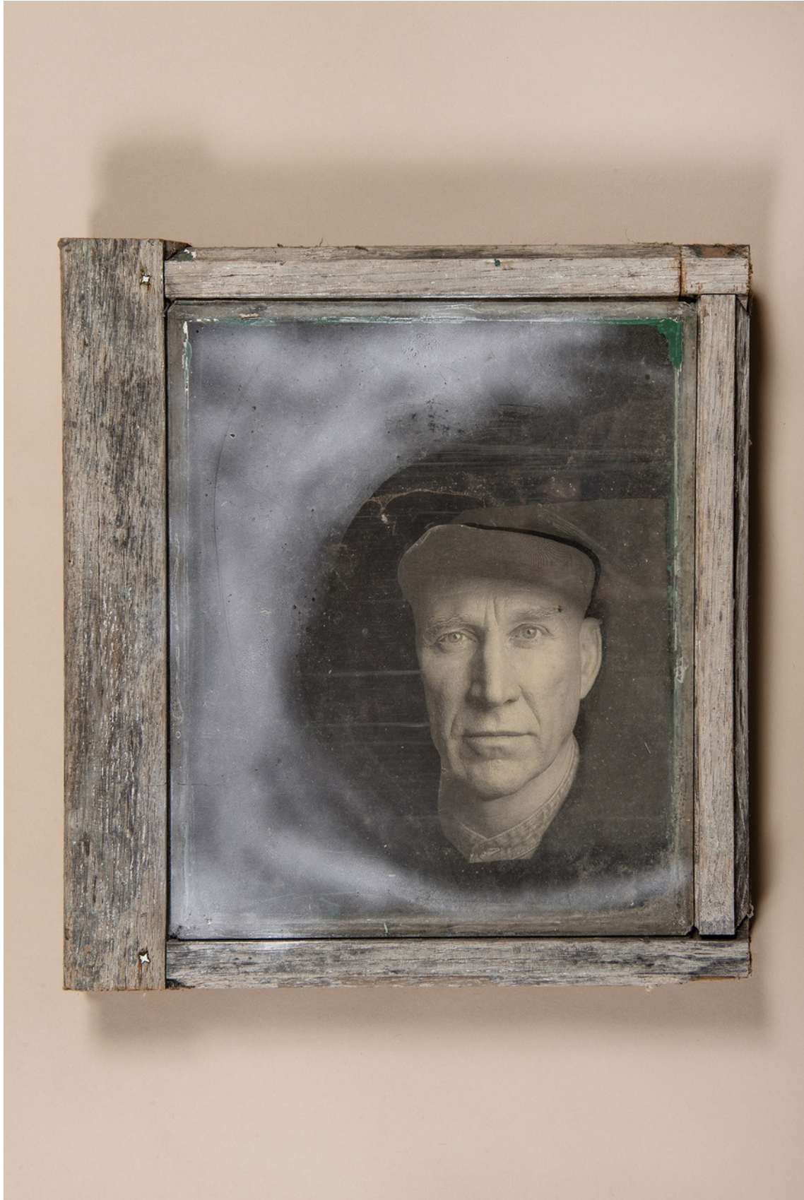
Bonjour Salgado, 2000