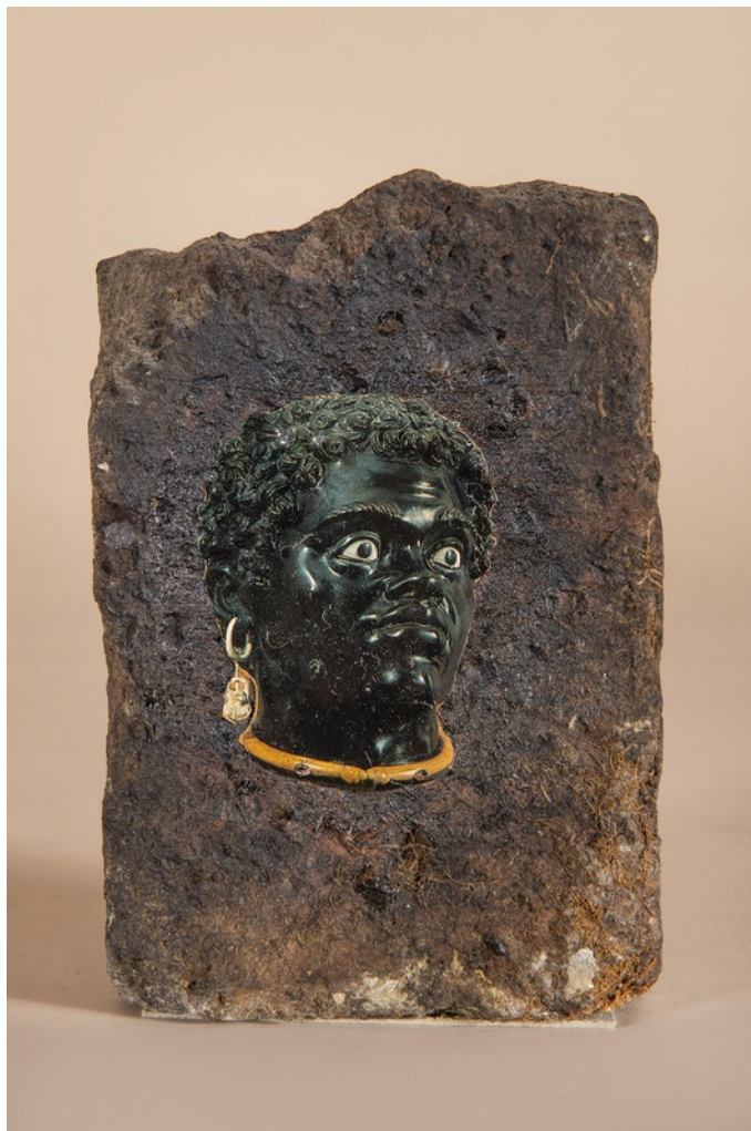
Tête de nègre, 2000