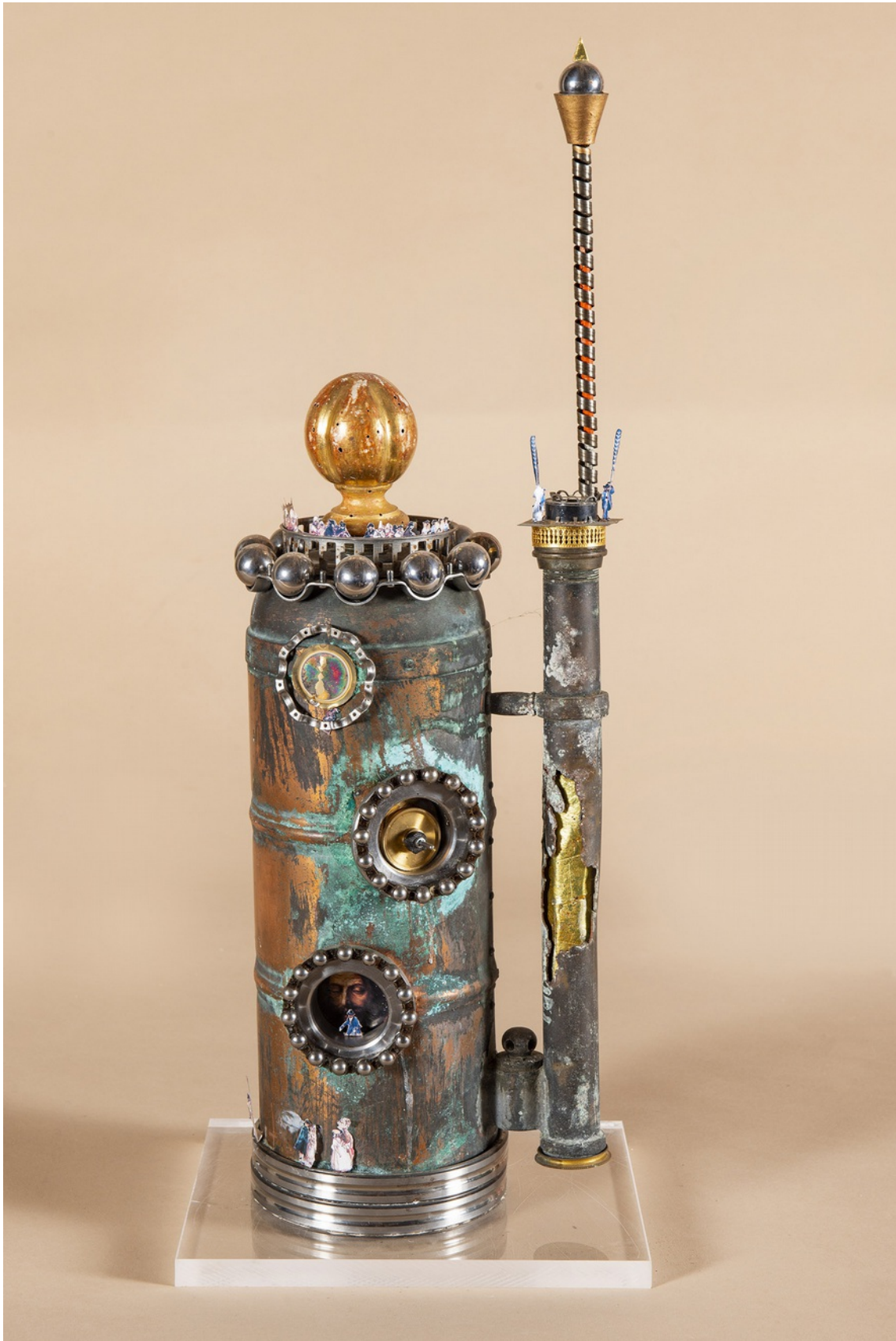
Visite de la tour, 2000