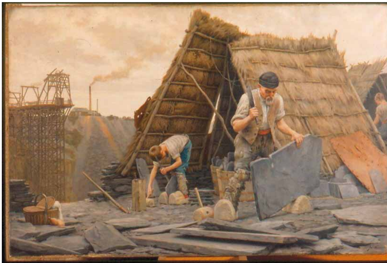
Fendeurs d'ardoises