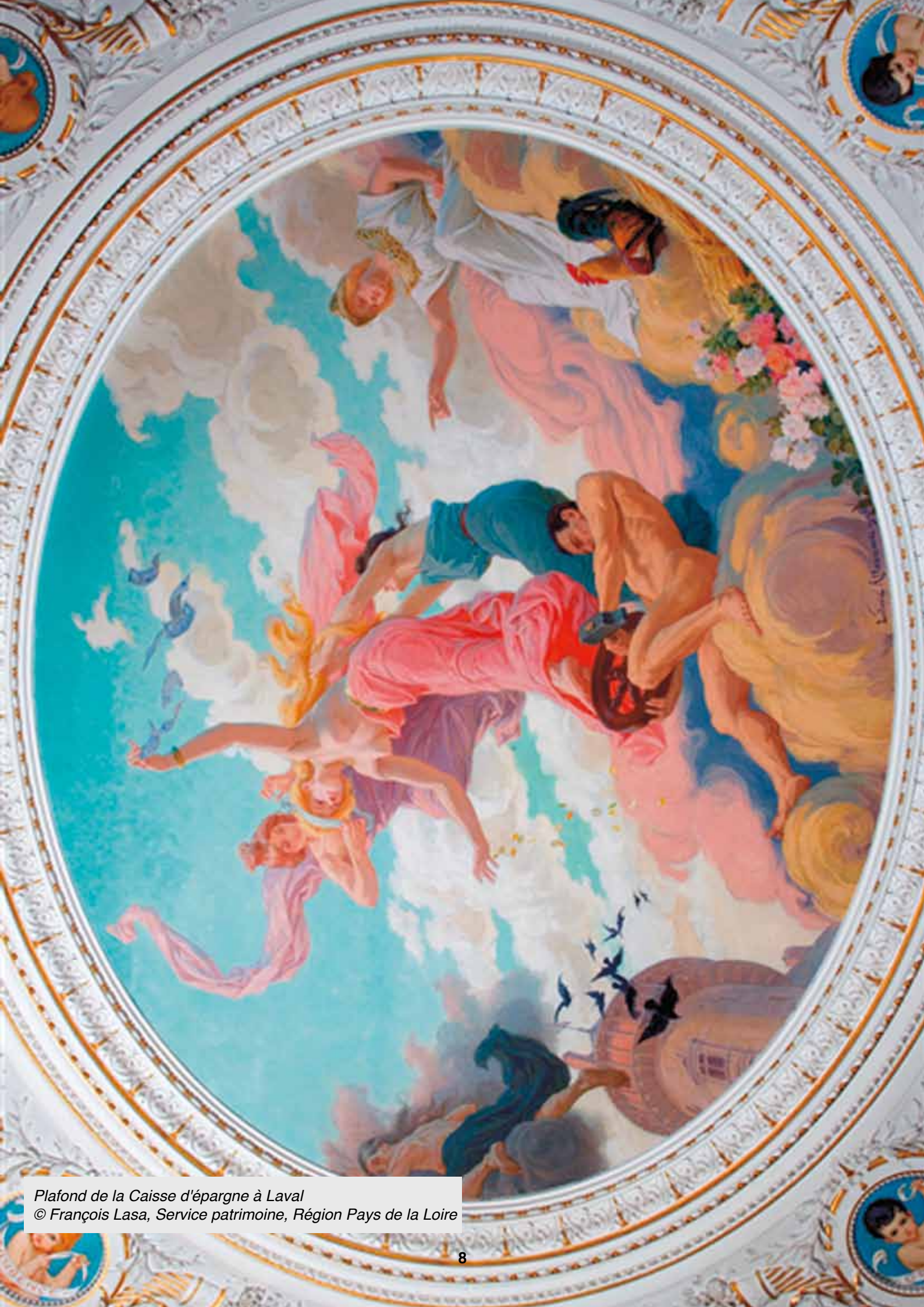
Plafond de la Caisse d'épargne à Laval